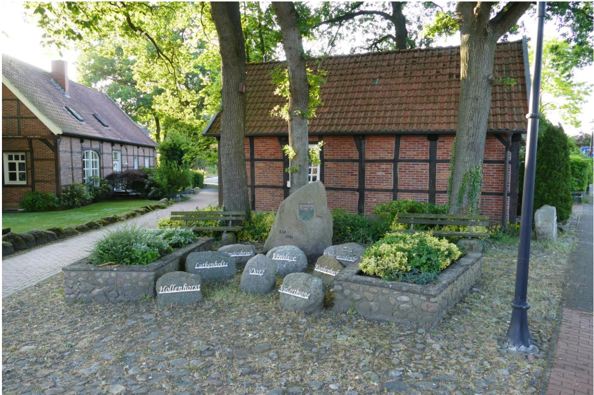
Bereich „Alte Färberei“