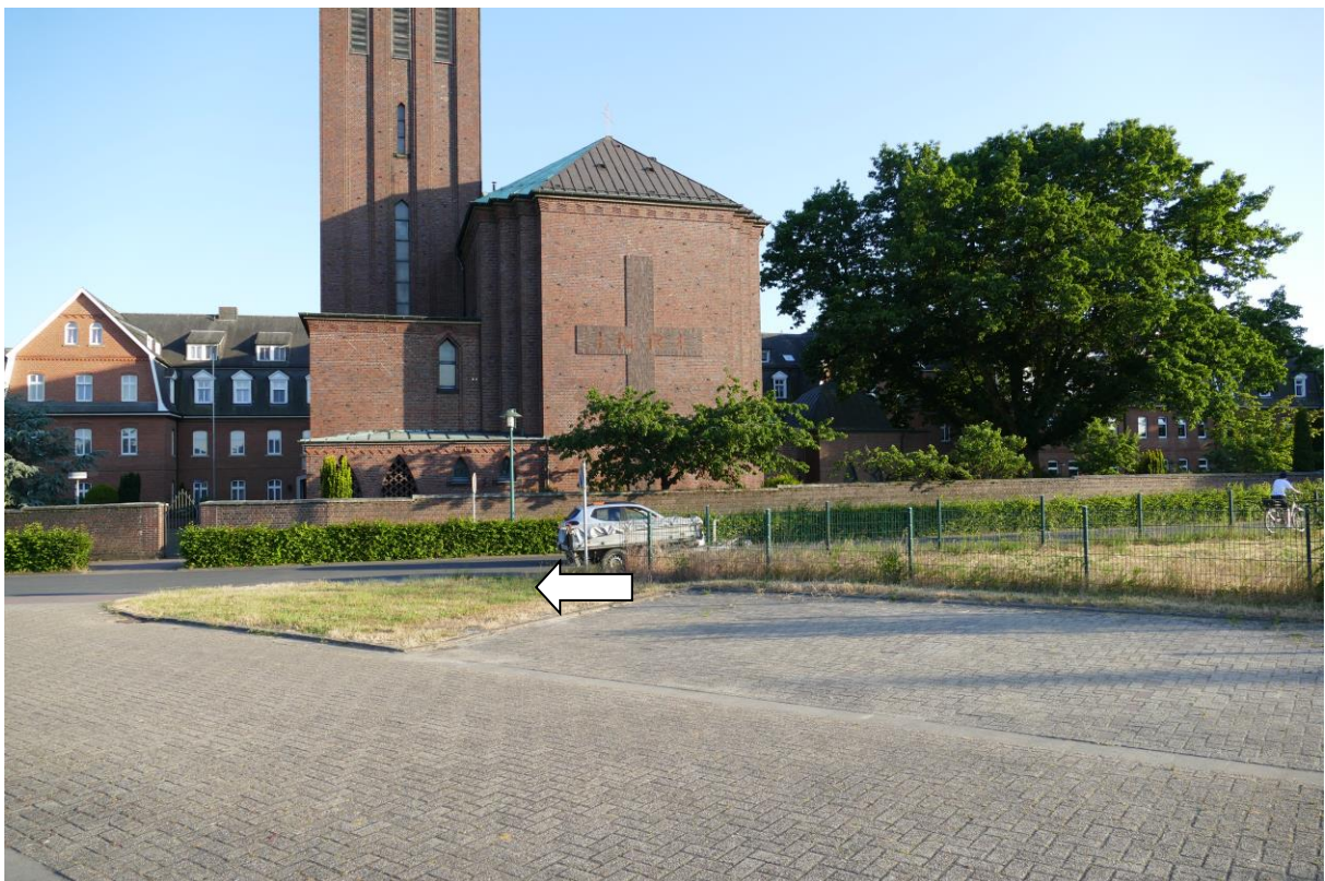
Bereich an der Mühlenstraße neben dem Regenrückhaltebecken