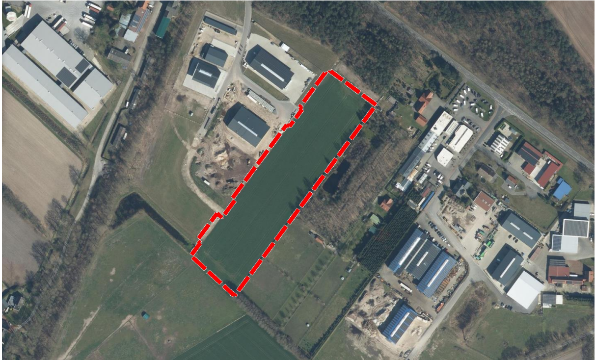
Abbildung 1: Luftbild mit Geltungsbereich, unmaßstäblich (NLWKN 2024)