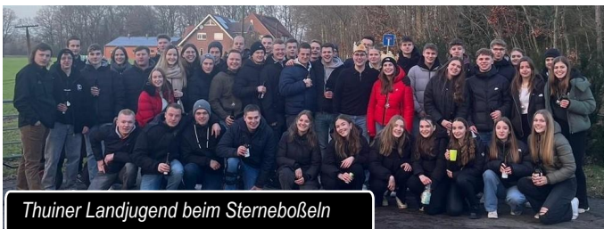
Thuiner Landjugend beim Sterneboßeln

Am Samstag, den 28.01.2024, stand endlich wieder das traditionelle Sterneboßeln an. Nachdem sich verschiedene Landjugenden an verschiedenen Standorten in Spelle getroffen haben, sind wir gemütlich zu Spieker-Wübbel nach Venhaus geboßelt. Dort angekommen gab es leckeres Essen und anschließend eine große Boßelparty.