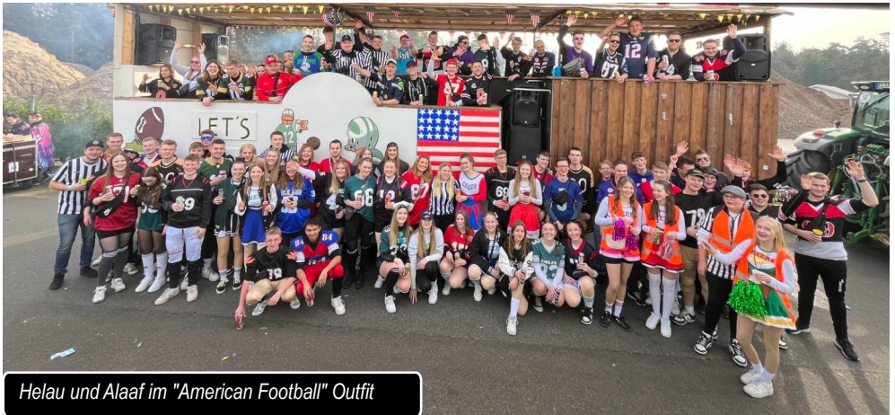
Helau und Alaaf im "American Football" Outfit

Die KLJB Thuine hat dieses Jahr an vier verschiedenen Karnevalsumzügen mit dem Motto „American Football“ teilgenommen. Der erste Umzug fand in Fürstenau statt. Am darauffolgenden Tag ging es für einen Teil der Mitglieder nach Lingen. Die meisten Mitglieder befanden sich beim Umzug in Bawinkel (10.02.2024), an dem rund 90 Personen teilgenommen haben. Wie jedes Jahr wurden am Rosenmontag die Thuiner Grundschule und der Thuiner Kindergarten besucht, um den Kindern vom Karnevalswagen aus Süßigkeiten zuzuwerfen. Anschließend sind wir weiter nach Emsbüren gefahren und haben an dem letzten Karnevalsumzug für dieses Jahr teilgenommen. Wir bedanken uns herzlich bei unseren Sponsoren!