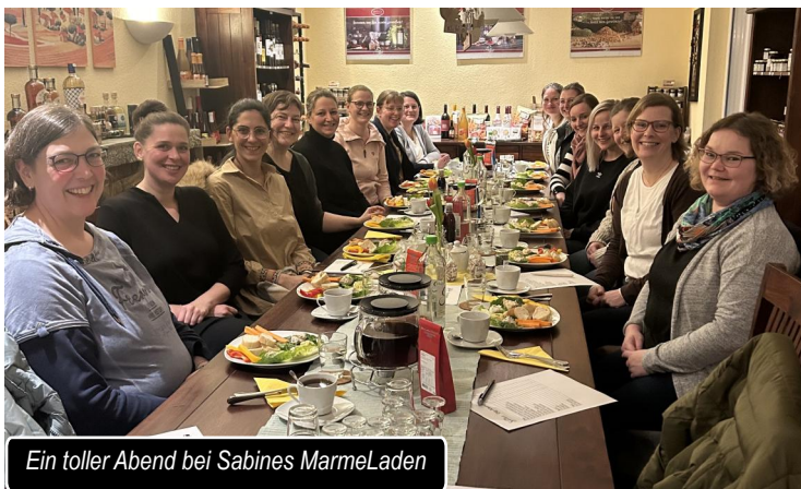
Ein toller Abend bei Sabines MarmeLaden

Anschließend durften wir nochmal 4 Knoblauchhaltige Dips probieren.